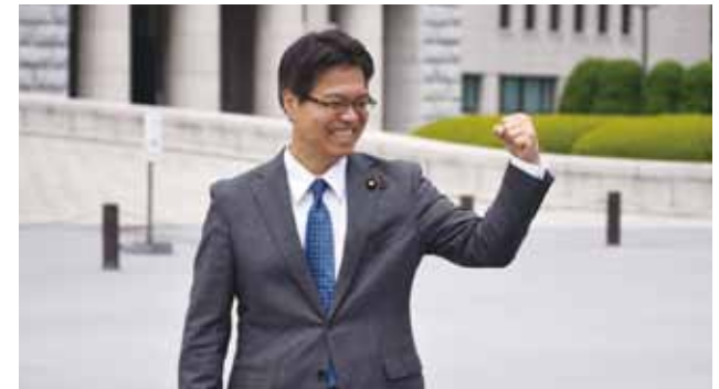
国会前で、決意新たに、笑顔でガッツポーズ!(8月10日)