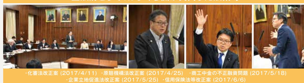
・化審法改正案(2017/4/11) ・原賠機構法改正案(2017/4/25) ・商工中金の不正融資問題(2017/5/18) ・企業立地促進法改正案(2017/5/25) ・信用保険法等改正案(2017/6/6)