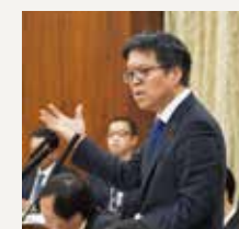
(災害対策特別委員会)